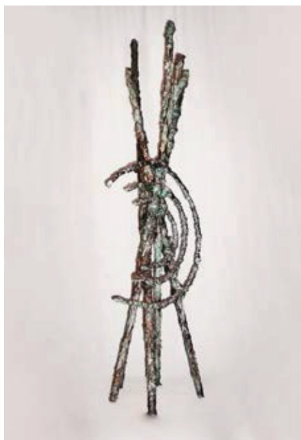
Senza tempo , tecnica mista (canne di bambù assemblate con resina e gesso da ceramica)