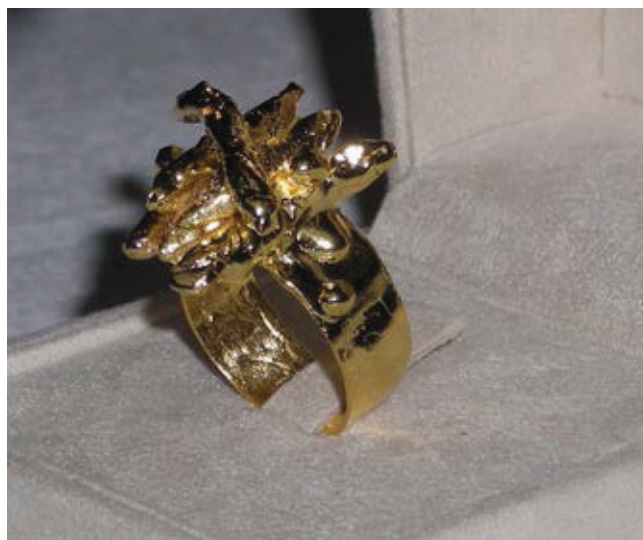
Anello, bronzo placcato oro